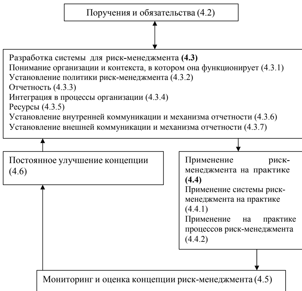
Схема 2 – Взаимосвязи между компонентами концепции риск-менеджмента

компоненты риск-менеджмента, и то, как они взаимодействуют в повторяющейся среде, как это показано в Схеме 2.