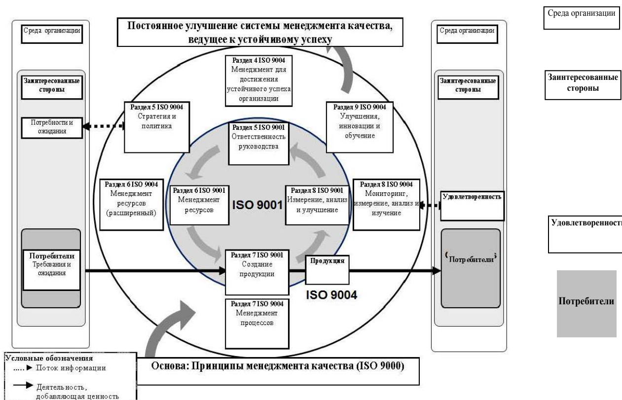
Рис. 1. Развернутая модель системы менеджмента качества, основанной на процессном подходе